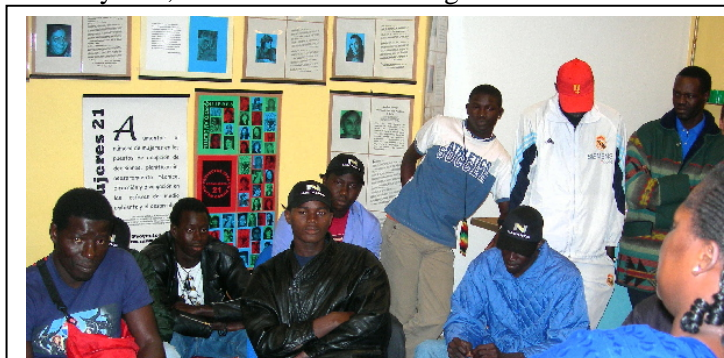
Una mujer africana de la ong, informa, extensamente a un grupo de jóvenes africanos recién llegados

e es la confianza mutua, que ya hemos conseguido... y sobre todo no dejarse influenciar por las “informaciones de otros inmigrantes”, que no exentas de buena voluntad y ganas de ayudar, les inducen a cometer graves errores.