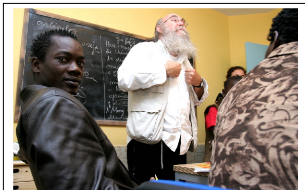
Informar con claridad y transmitir cariño.....